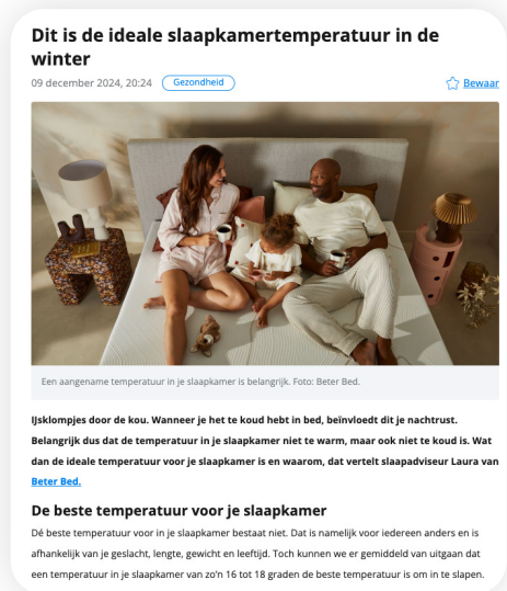
- Voorbeeld sponsored article

Een sponsored article is dé manier om jouw merk subtiel en effectief onder de aandacht te brengen. In een zorgvuldig geschreven of geredigeerd artikel in combinatie met een weer-gerelateerd onderwerp wordt jouw boodschap naadloos verweven met relevante, waardevolle content voor de lezer.